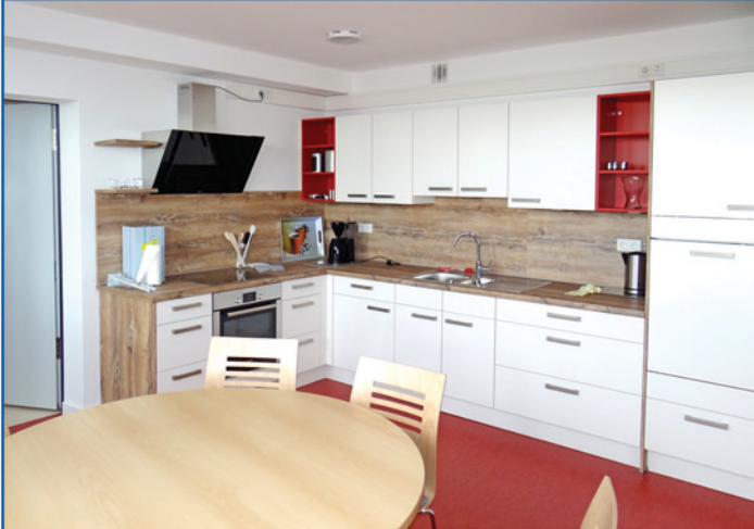
2. OG - Küche mit anschließendem Aufenthaltsraum