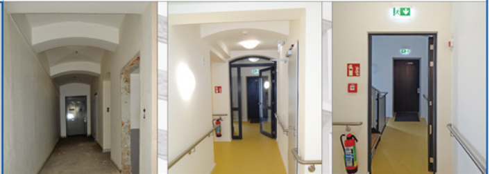
Fluransicht mit Fahrstuhl - vorher, nachher

Umbau und Kernsanierung des alten Wolfhager Amtsgerichts zu einem Wohnheim für Menschen mit Behinderungen, Gerichtsstraße 5, Wolfhagen Bauherr Baunataler Diakonie Kassel e. V., Kirchbaunauer Str. 19, 34225 Baunatal Planungs-/Bauzeit NF/NGF/BGF BRI/LPH Baukosten/Netto 01.2014-08.14; 05.2014-03.15 617 m 2 /979 m 2 /1.350 m 2 5.300 m 3 /5-9 1,02 Mio. €