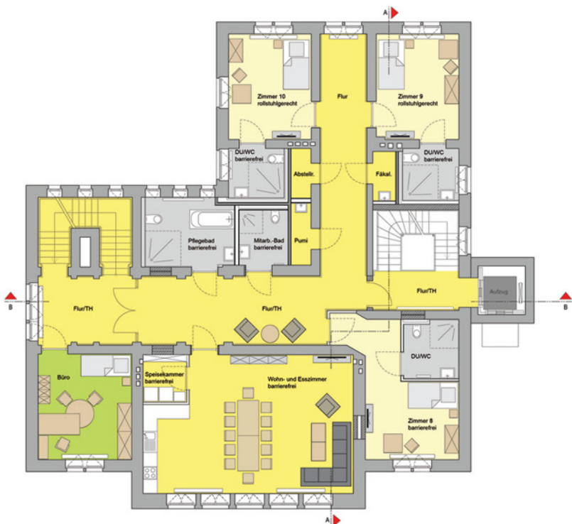
Grundriss 1. Obergeschoss

Umbau und Kernsanierung des alten Wolfhager Amtsgerichts zu einem Wohnheim für Menschen mit Behinderungen, Gerichtsstraße 5, Wolfhagen Bauherr Baunataler Diakonie Kassel e. V., Kirchbaunauer Str. 19, 34225 Baunatal Planungs-/Bauzeit 01.2014-08.14; 05.2014-03.15 NF/NGF/BGF 617 m 2 /979 m 2 /1.350 m 2 BRI/LPH 5.300 m 3 /5-9 Baukosten/Netto 1,02 Mio. €