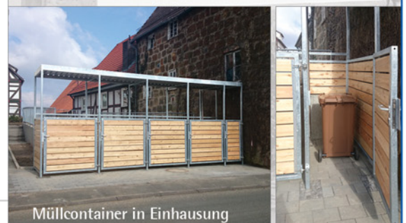
Müllcontainer in Einhausung