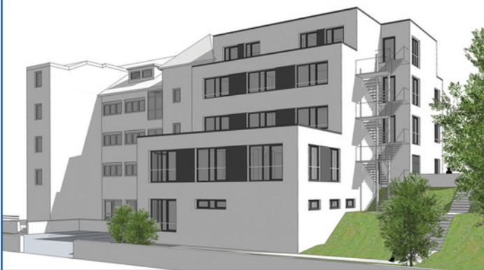
Perspektive von Nordost - Planung