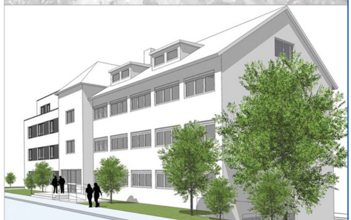
Perspektive von Südwest - Planung