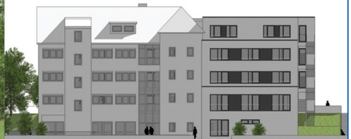
Ansicht von Osten - Planung