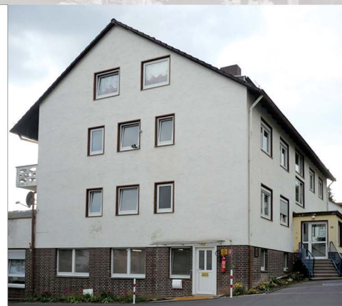
Ansicht Nordostseite, Bestand