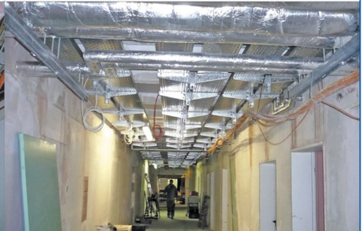
Flur H15 Kellergeschoss – In der Sanierungsphase

Die Deckenertüchtigungen sind fertiggestellt. Die Elt-Trassen sind eingebaut und belegt. Nur noch Einzelkabel sind provisorisch verlegt.