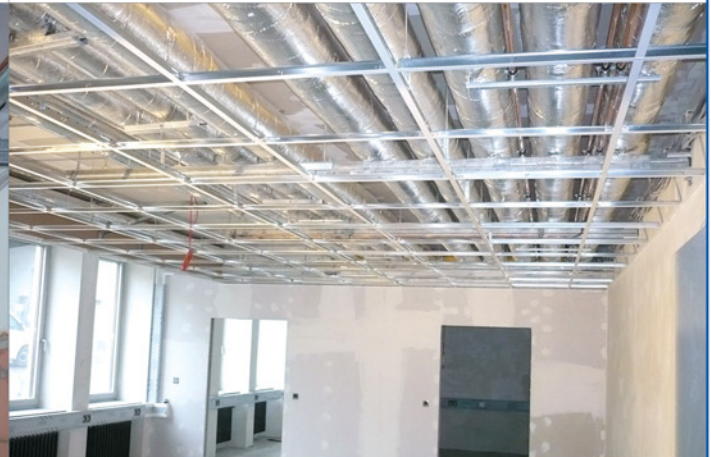
Raum H24 Kellergeschoss – In der Sanierungsphase

Deckenertüchtigungen und HLS-Installationen sind fertiggestellt. Deckenraster der Sichtdecken sind eingebaut. Wände sind durch Maler, Böden durch Bodenverleger vorbereitet.