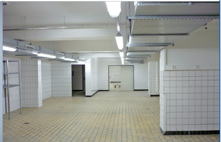
Bettzentrale B05 – Kellergeschoss

Nach Sanierung, vor Nutzung / Inbetriebnahme