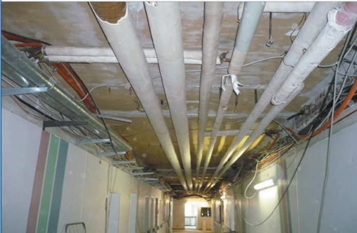
Flur H15 Kellergeschoss – Zu Beginn der Sanierungsarbeiten

Nach Ausbau der Unterdecken und Teilrückbau haustechnischer Leitungen. Die Schilfrohrdecken unterhalb der Stb-Rippendecken sind noch eingebaut.