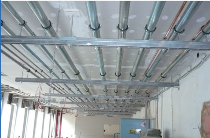
Raum H24 Kellergeschoss – In der Sanierungsphase

Deckenertüchtigung unter freigelegten Stb-Rippendecken ist erfolgt. HLS-Trasse neu unterhalb der Deckenertüchtigung.