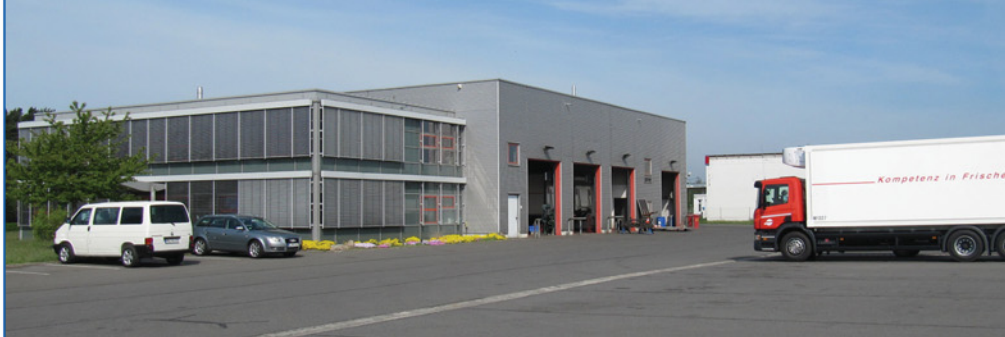
Ansicht von Süden - Eingang Verwaltungstrakt