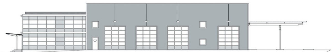
Ansicht von Osten