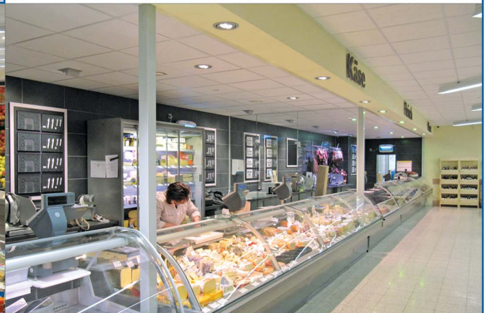
Teilansicht Fisch-, Käse- und Fleischtheke