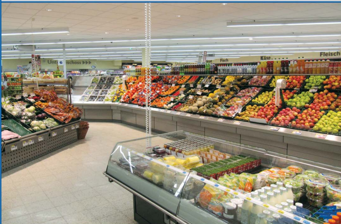
Teilansicht Obst- und Gemüseabteilung

Brandschadensanierung eines zweigeschossigen EDEKA-Lebensmittelmarktes, Kassel-Kirchditmold Hessenring Grundstücksgesellschaft mbH, Industriegebiet Pfieffewiesen, 34212 Melsungen 2012-2013 o. A. o. A. 0,50 Mio. € Bauherr Baujahr Nutzfläche Bruttorauminhalt Baukosten/Netto