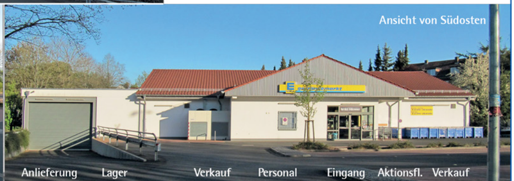
Ansicht von Südosten