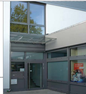
Gesamtansicht von Norden - Sparkasse, Markt, Backshop, Artpraxis und Apotheke