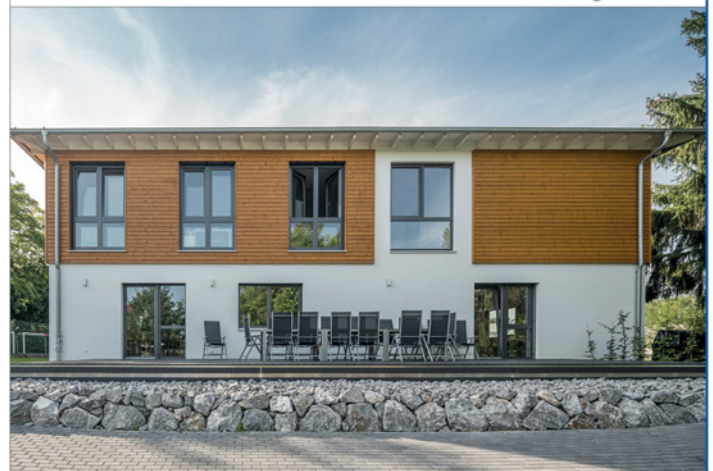
Ansicht von Südost mit Terrasse