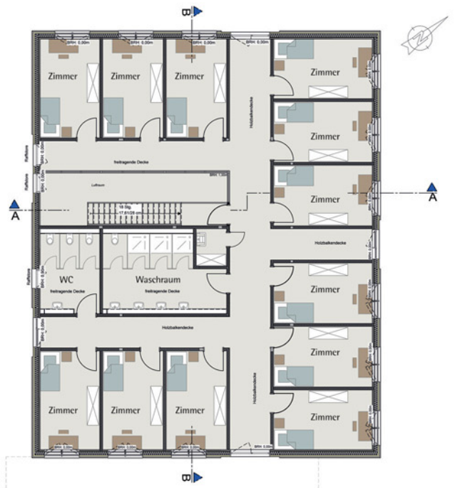
Grundriss 1. Obergeschoss