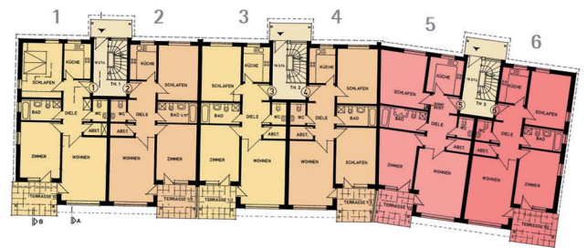
Grundriss (Wohnung 1-6)

Neubau von 12 Eigentumswohnungen, Narzissenweg, Kassel-Harleshausen Bauherr Wohnpark Harleshausen GbR Hermanns - Emmeluth - Richter Baujahr 1997 Nutzfläche 683 m 2 Bruttorauminhalt 1.192 m 3 Baukosten/Netto 1,07 Mio. €