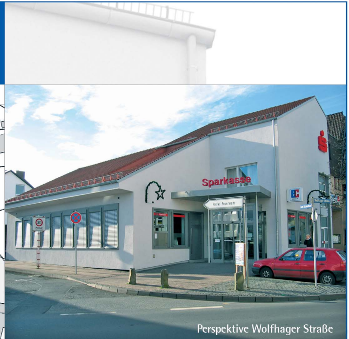
Perspektive Wolfhager Straße

Sanierung der Kasseler Sparkasse, Filiale Kassel-Harleshausen