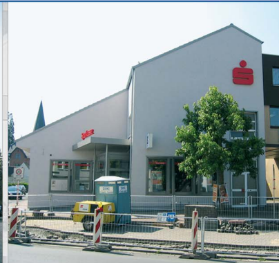
Perspektive von Norden