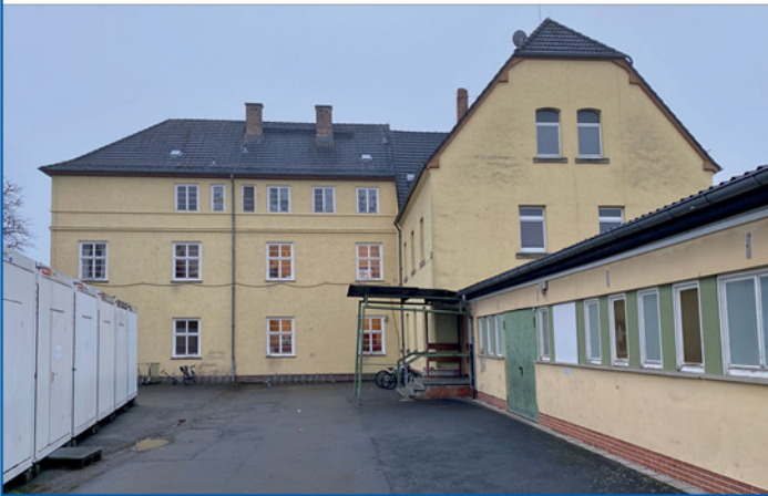
Bestandsfoto von Osten – Gebäude Abbruch