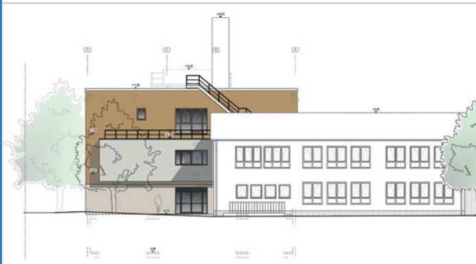
Ansicht von Südost – Neubau