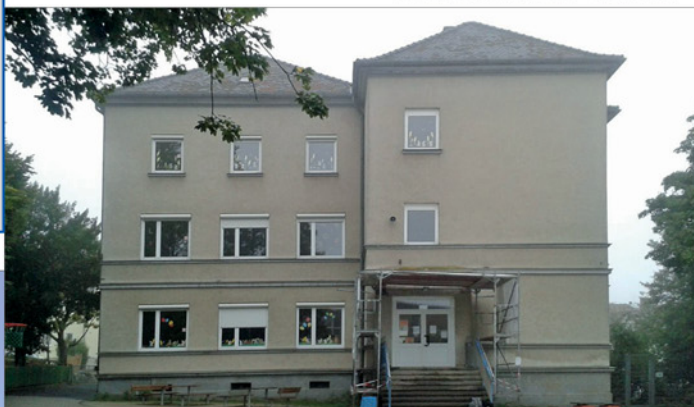
Ansicht von Osten - Bestand