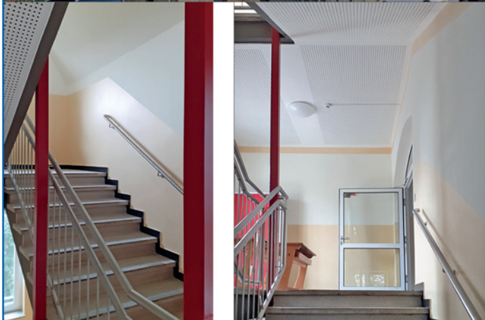
Ansicht Treppenhaus - Neuanstrich, Erneuerung Beleuchtung