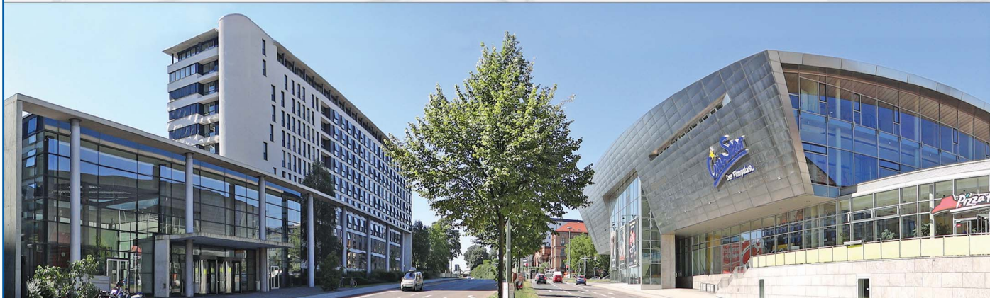
Straßenansicht Steinweg mit Cine-Star (ebenfalls ein BSH-Projekt)