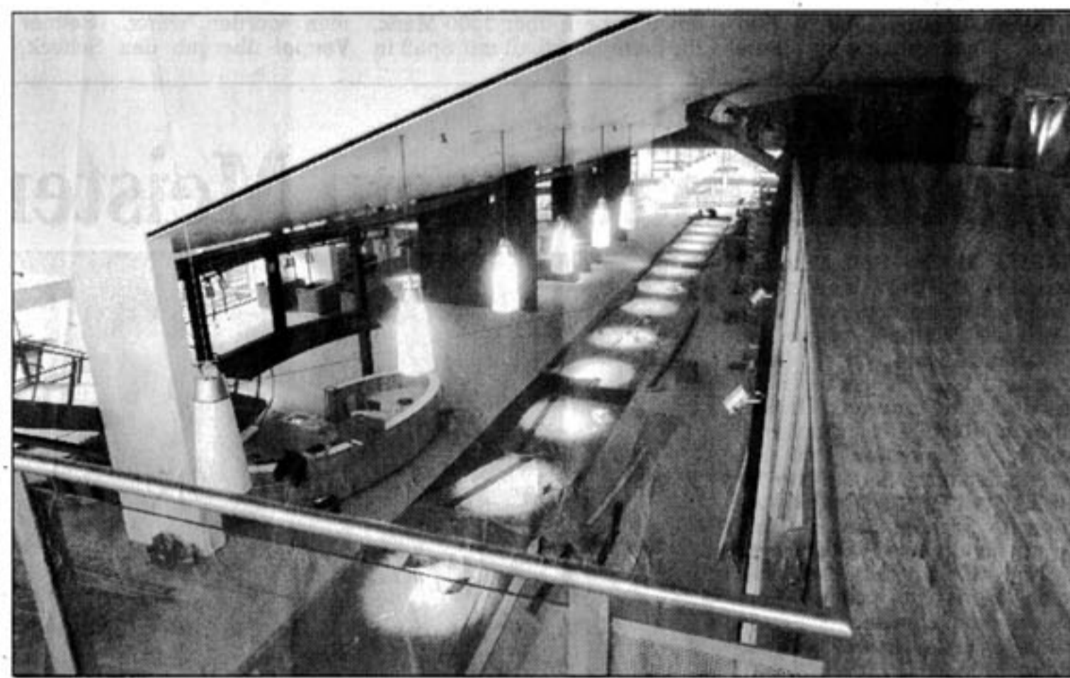
Blick von der ersten Ebene ins Foyer

Die Finanzierung bestreift die DEGI Deutsche Gesellschaft für Immobilienfonds mbH, eine Tochter der Dresdner Bank AG in Frankfurt. Das Objekt wurde für den von ihr verwalteten Grundwert-Fonds erworben. Die UFA-Theater AG ist Generalmieter mit einem langfristigen Vertrag. Die Investitionskosten für den von der UFA übernommenen Innenausbau belaufen sich auf rund sieben Mio. Mark.