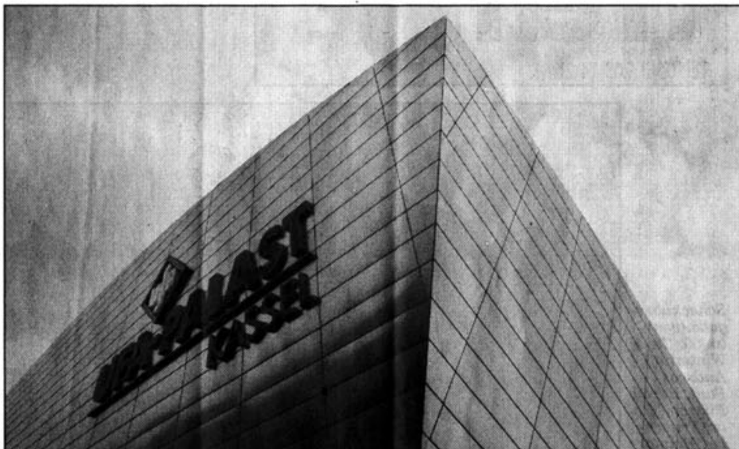
Wie ein Schiffsbug wirkt diese freitragende Ecke des Kinos, die über den Steinweg reicht. Die mit Edelstahlplatten verkleidete Fassade reflektiert die Umgebung.

Durch die zentrale Lage ist der UFA-Palast sowohl mit dem öffentlichen Personennahverkehr als auch mit dem Pkw gut zu erreichen. Die Friedrichsplatz-Tiefgarage liegt nah am Kino. An der Oberen Karlsstraße stehen zudem Behindertenparkplätze zur Verfügung. Für Zweiradfahrer werden 70 Fahrradabstellplätze installiert.