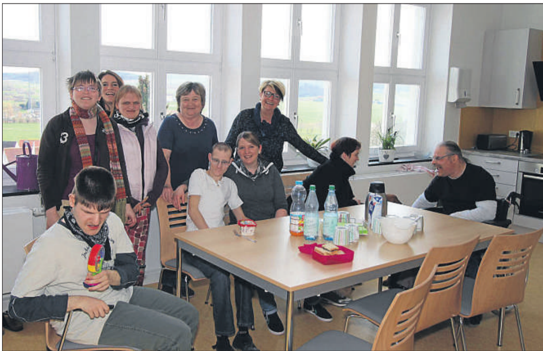
Tolle Gemeinschaft: Die Bewohnerinnen und Bewohner bilden mit den Betreuerinnen eine Gemeinschaft, die sich prächtig versteht.

Wohneinrichtung der bdk's Baunataler Diakonie Kassel im Alten Amtsgericht