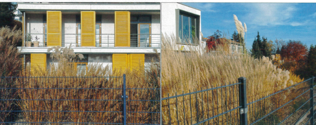
Die unteren Wohnräume auf der Südseite werden zur Straße hin abgeschirmt durch ein Band von Calamagrostis brachytricha , seitlich eingefasst von Miscanthus 'Gracillimus' .