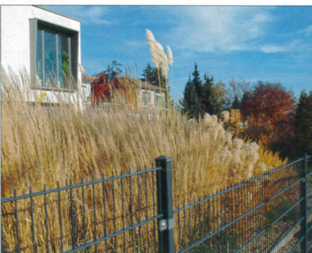
Unter dem Wohnzimmer-Fenster: der Gräserhügel mit einer größeren Gruppe von Calamagrostis x acutiflora 'Karl Foerster', Miscanthus 'Prof. Richard Hansen' und Pampasgras.