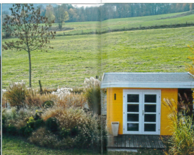
Modernes Design, gewagte Farben und Natur pur müssen kein Widerspruch sein. Die „geborgte Bebauungsrand verleiht der Gräser und Natur pur müssen kein Landschaft“ am pflanzung zusätzliche Weite.

ohne Weiteres auch mit kleinen und mittelgroßen Gehölzen in Strauchrabatten stehen. Als Nachbarn geeignet sind Hortensien ( H. macrophylla , paniculata , quercifolia ), Strauch-Johanniskraut ( Hypericum frondosum , inodorum androsaemum ), kleinwüchsige Deutzien ( Deutzia compacta , gracilis , x kalmiiiflora , x rosea ), Immergrüne Zistrose ( Cistus laurifolius ), Schmalblättriger Faulbaum ( Frangula alnus 'Asplenifolia' ), Zwerg-Flieder ( Syringa meyeri , microphylla ), Berberitzen ( Berberis koreana , B. thunbergii 'Rose Glow'), Fingerstrauch ( Potentilla fruticosa -Sorten und P. fruticosa var. mandschurica ) oder Leycesterie ( Leycesteria formosa ). Wichtig ist, von Anfang an genügend Platz für die spätere Wuchsbreite von Gehölzen und Gräsern einzuplanen.