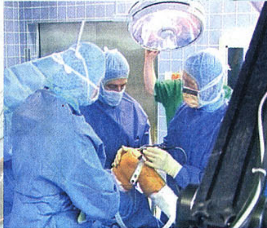
Präzisionsarbeit beim Einsetzen einer Knie-Endoprothese.